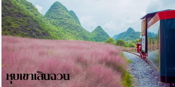
หุบเขาเสินฉวน

๑๐|บริการอาหารเช้า ณ ห้องอาหารของโรงแรม(1)