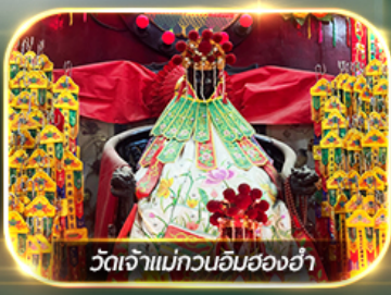
วัดเจ้าแม่กวนอิมสองอ้า