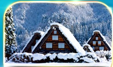
ชมงานประดับไฟนาบามา โนะ ซาโตะ