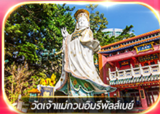
วัดเจ้าแม่กวนอิมรพาสันย่