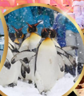
สวนสัตว์ อาซาฮิยาม่า