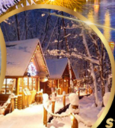
หมู่บ้านเทพนิยาย นิงเกิลเทอเรส