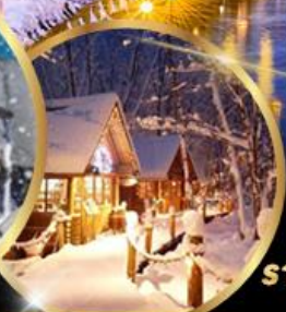
หมู่บ้านเทพนิยาย นิงเกิลเทอเรส