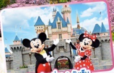
อิสระท่องเที่ยว 1 วันเต็ม