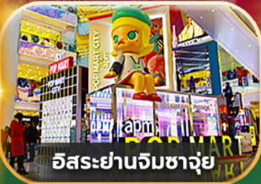
อิสระย่านจิมซาจุ่ย