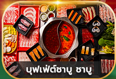
บุฟเฟ่ต์ซาซุ ซาซุ