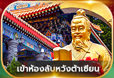
เข้าห้องลับหวังต้าเซียน