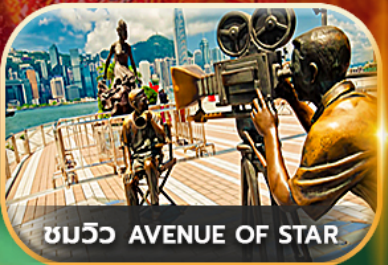
ชมวิว AVENUE OF STAR