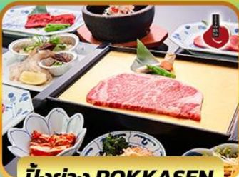
บั้งย่าง ROKKASEN