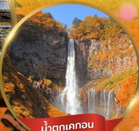
น้ำตกเคกอน