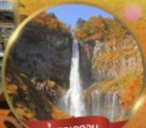
น้ำตกเคทงอน