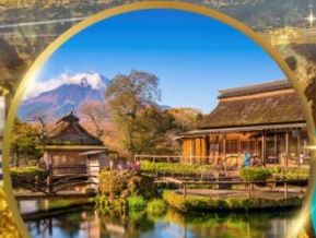
หมู่บ้านโอชิโนะฮักโก