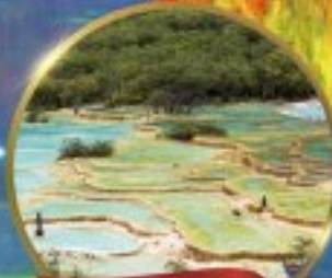
อุทยานหวงหลง