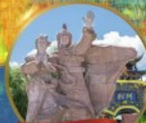
เมืองโบราณชงฟาน