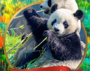
หมีแพนด้าเจียงเยียน

T2G-TFU05SL หนีนหนาว เจิงตุ... จิวจ้ายโกว หองหลง ต่ากู่ปิงชวณ 6D 5N (SL) ไม่ลงร้านรัฐบาล