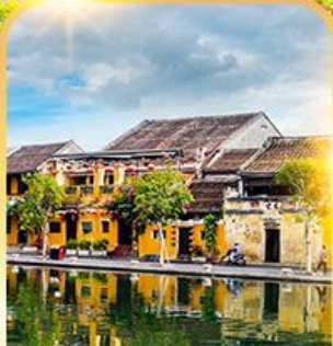
เมืองมรดกโลกฮอยอัน

ดานัง ฮอยอัน บานาฮิลล์ เที่ยวบานาฮิลล์เต็มวัน รวมบัตรเครื่องเล่น