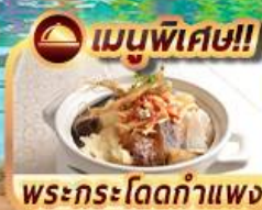
เมนูพิเศษ!! พระกระโดดกำแพง