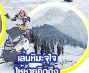
เล่นหิมะ-จ๊ว ให้หายคิดถึง