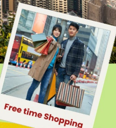
Free time Shopping