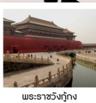
พระราชวังทงกิง