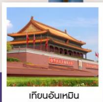
เทียนอันเหมิน