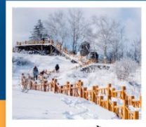
เขาเกาะหยู่

ฟรี!! ...ถุงมือ ผ้าพันคอ หมวก ท่านละ 1 ชุด