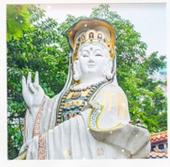
เจ้าแม่กวนอิมธิพลัสสมัย