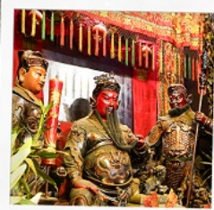
เทพเจ้ากวนอู วัดถุนไถ