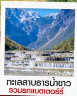
ทะเลสาบธารน้ำขาว รวมรถแวนเตอร์รี่