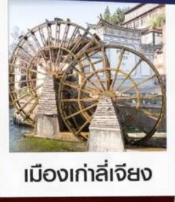
เมืองเก้าลี่เจียง