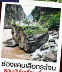
ช่องแคบเสือกระโจน รวมบันไดเลื่อน ขึ้น-ลง