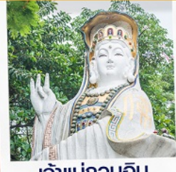
เจ้าแม่กวนอิม ริฟลิสเบย์