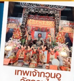
เทพเจ้ากวนอู วัดกวนไท่