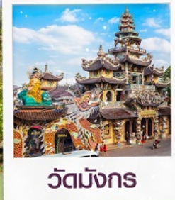
วัดมังกร