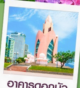
อาคารตอกบัว