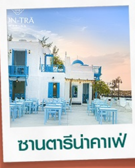
ซานตารีนาคาเฟ่