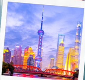
ทิวทัศน์