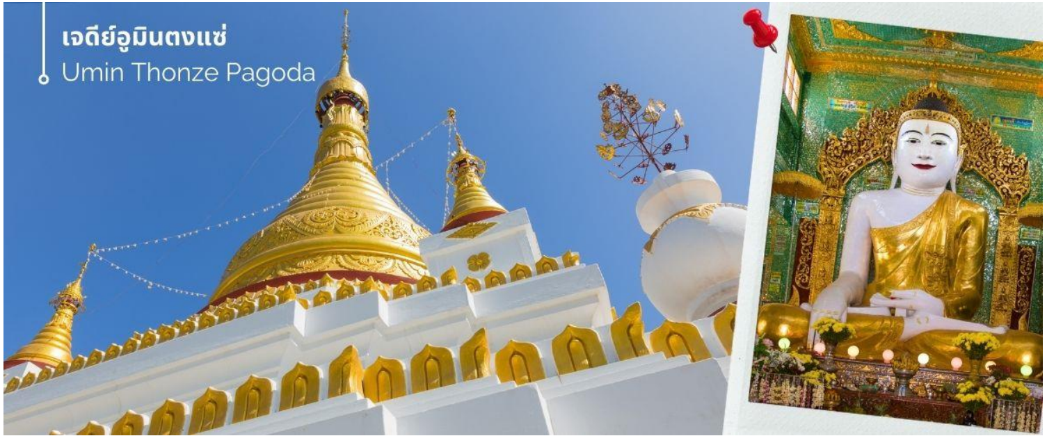
เจดีย์อุมินตงแซ่

จากนั้นนำท่านชม เจดีย์อุมินตงแซ่ ขอพร พระทันใจ (Umin Thonze Pagoda) ตั้งอยู่ที่ดอยสุริเยอุมินตงแซ่ อยู่ห่างเหนือประมาณ 1200 เมตร เป็นวัดผสมผสานที่มีชื่อเสียงที่สุดคือ ทางเดินรูปพระจันทร์เสี้ยว ภายในมีพระพุทธรูป 45 องค์ ทางเดินรูปพระจันทร์เสี้ยวทั้งหลังมีซุ้มประดับประดาสวยงามทั้งหมด 30 ซุ้ม หมายถึง ถ้ำที่พระสงฆ์หนึ่งสมาธิ ส่วนชื่อวัด อุมิน แปลว่า ถ้ำ ตงแซ่ หมายถึง 30 ด้าน ด้านข้างทางเดินมีพระวิหารสี่เหลี่ยม ภายในประดิษฐานพระพุทธรูปขนาดต่างๆ กว่าสิบองค์ บนเนินเขาด้านหลังทางเดินยังมีกลุ่มพระอุโบสถและเจดีย์ที่มองเห็นทิวทัศน์ที่สวยงามของภูเขาสุริเยและแม่น้ำอิรวดี