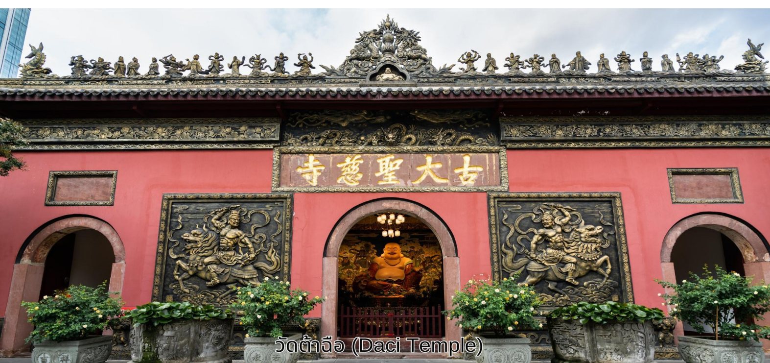
วัดต้าจื่อ (Daci Temple)

บ่าย จากนั้นเดินทางไปยัง วัดต้าจื่อ เป็นวัดเก่าแก่ที่มีอายุยาวนานกว่า 1,600 ปี ตั้งอยู่ใจกลางของ Chengdu ที่นี่ถือเป็นสถานที่สำคัญที่น่าสนใจ เพราะเป็นวัดที่พระถังซำจั๋งรับบวชเป็นพระภิกษุ ก่อนจะย้ายไปจำพรรษายังวัดอื่นภายในวัดต้าจื่ออันเจียบสงบ จากนั้นนำท่านสู่ ถนนคนเดินชุนซีลู่