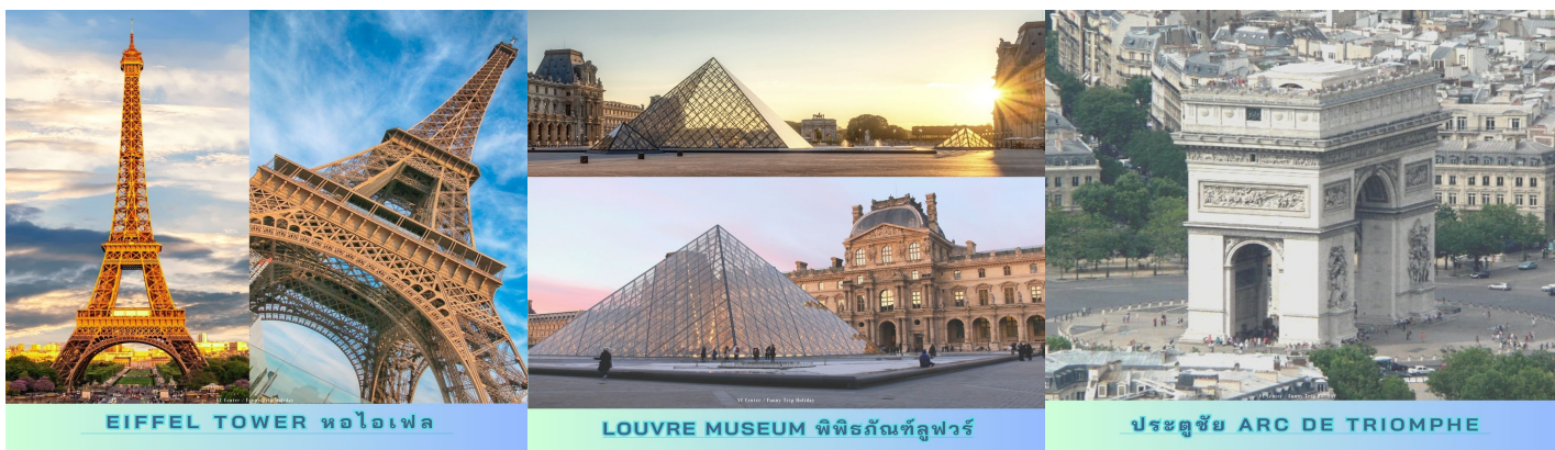
EIFFEL TOWER หอไอเฟล

นำท่าน ชมหอไอเฟล (EIFFEL TOWER) ซึ่งเป็นสัญลักษณ์ของกรุงปารีส เลิศหรู อลังการ โรแมนติค มหัศจรรย์ ด้วยความสูง 984 ฟุต สร้างด้วยโครงเหล็กทั้งหมด...ถนนชองเซลีเซ (CHAMPS-ELYSEES) ถนนที่มีต้นไม้เรียงรายทั้งสองข้างทางอย่างน่าเดินเล่น ต้นแบบถนนราชดำเนิน ปลีซเดอลา ค็องคอร์ด (PLACE DE LA CONCORDE) จตุรัสแห่งความสามัคคี โบสถ์แมตติแลน ที่สร้างแบบกรีกโบราณ ถ่ายรูปกับปิระมิดหน้าพิพิธภัณฑสถานลูฟวร์ หรืออดีตพระราชวังลูฟวร์ จากนั้นนำท่าน ชมเมืองปารีส มหาราชินีแห่งเมืองหลวงของโลก ..ถ่ายรูปคู่กับประตูชัย (ARC DE TRIOMPHE) ของพระเจ้านโปเลียนอาร์ค เดอทร็อม ให้ท่านช้อปปิ้งสินค้าแบรนด์เนมที่มีชื่อเสียง ณ ห้างเกลอรีลาฟาแยส เช่น หลุยส์,