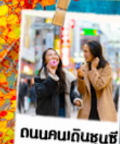
ถนนคนกินชุนซ์