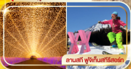
ลานสกี ฟุจิกั้นสกีรีสอร์ท