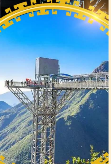
สะพานแกว้มิงกรเมซ