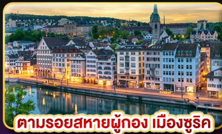
ตามรอยสหายผู้กอง เมืองซูริก