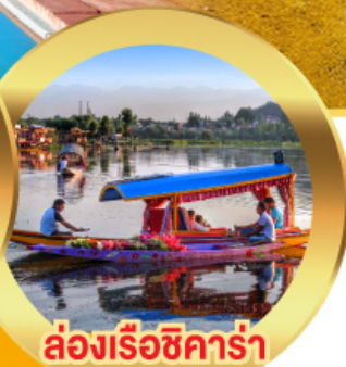
ล่องเรือซิการ์่า