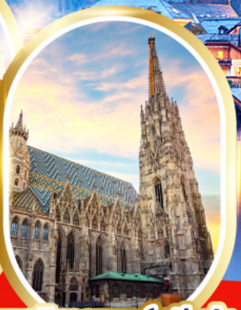
มหาวิหารเซนต์สตีเฟ่น