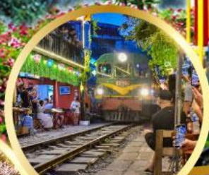
ร้านกาแฟรถไฟ