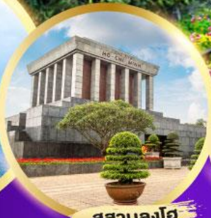
สุสานลุงโฮ