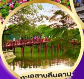
ทะเลสาบคินดาบ