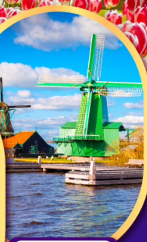
หมู่บ้านกังหันลม ซาสคินส์