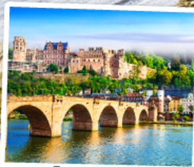
ไฮเดลเบิร์ก