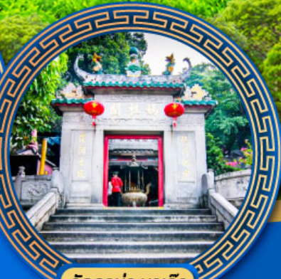
วัดเจ้าแม่กวนอิมสองห้า