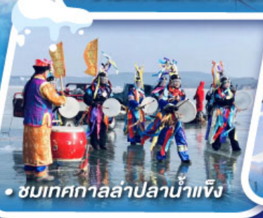
• ชมเทศกาลล่าปลาน้ำแข็ง