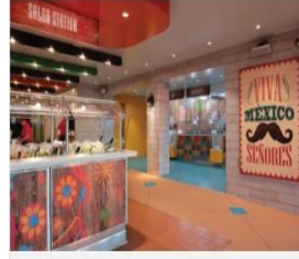
EL LOCO FRESH