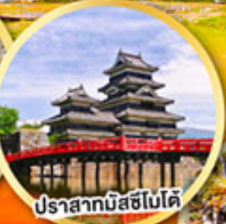
ปราสาทมัสชิโมโด้