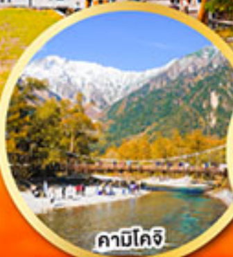
คามิโคจิ

ชมใบไม้เปลี่ยนสีหุบเขาโคริงเค คามิโคจิ สวรรค์บนดินแห่งเทือกเขาแอลป์ ชมอุโมงค์ไบเมเบิล โมมิจิ ไคโร ชมถนนต้นแปะทิว อีโซ นามิอิ