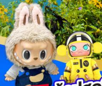
POP MART ซ้อปสุดฮิต