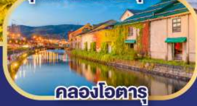
คลองโอดารุ

เที่ยวเต็มทุกวัน ไม่มีฟรีเคย์ ชมใบไม้เปลี่ยนสีหุบเขานรกจิโกกุคานิ