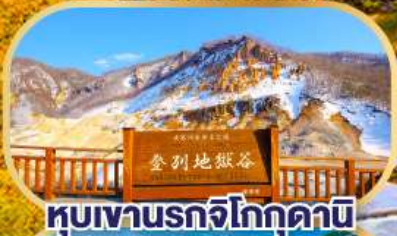
หุบเขานรกจิโกกุคานิ