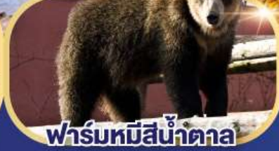
ฟาร์มหมีสีน้ำตาล