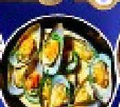
หอยนางรมเบลเยียม