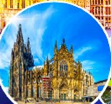
มหาวิหารแห่งโคโลญ