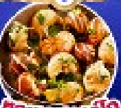
คอยออสตาร์โท

เดินทาง 5 17-25 ก.ย.67/11-19,18-26 ต.ค.67 14-22 พ.ย.67/30 พ.ย.-8 ธ.ค.67 25 ธ.ค.67 - 2 ม.ค.68(เทศกาลปีใหม่)