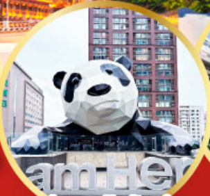
หมีแพนด้าป็นตึก