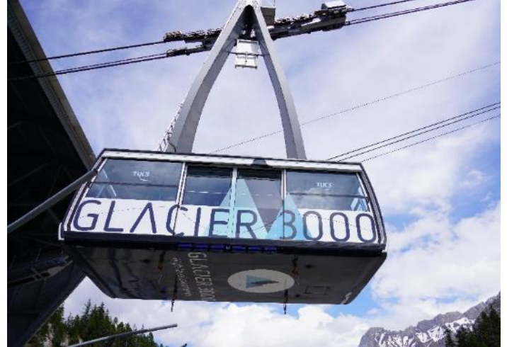
Highlight ! กระเช้าไฟฟ้าขนาดยักษ์ที่จุผู้โดยสารได้ถึง 125 คน

เช้า ๑๑ รับประทานอาหารเช้า ณ โรงแรม (มื้อที่9) นำท่านเดินทางสู่ หมู่บ้านโคล เดอ ปียง (Col De Pillon) ประเทศสวิตเซอร์แลนด์ (ระยะทาง 292 กม. / 4.30 ชม.) เป็นที่ตั้งของสถานี จากนั้นนำท่านนั่งกระเช้าลอยฟ้า สู่ ยอดเขากลาเซียร์ 3000 (Glacier 3000) มีความสูงเกือบ 3,000 เมตรเหนือระดับน้ำทะเล ชมทิวทัศน์อันงดงามของท้องฟ้าและเทือกเขามากมายแบบพาโนรามา และให้ท่านทำกายภาพสูงเดินบนสะพาน "The Peak Walk by Tissot" สะพานแขวนที่มีความยาว 107 เมตร ข้ามหน้าผาที่ระดับความสูง 3,000 เมตร ทำให้เป็นสะพานแขวนที่สูงที่สุดในโลก อีสาระให้ท่านสนุกสนานกับกิจกรรมตามอัธยาศัย (ราคาทัวร์รวม Peak walk and View point / Glacier Walk / Ice Express (chairlift) / Fun Park กรุณาเช็คเครื่องเล่นต่างๆ กับหัวหน้าทัวร์อีกครั้ง)