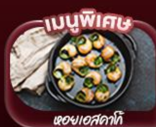
เมนูพิเศษ