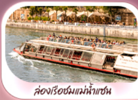
ล่องเรือชมแม่น้ำแซน