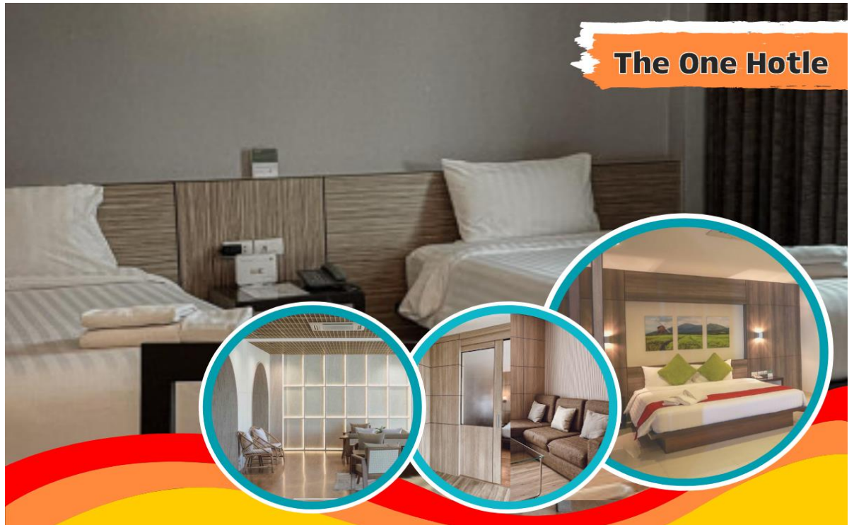
The One Hotle

พักที่...โรงแรม THE ONE HOTEL หรือระดับเทียบเท่า 4* (บึงกาฬ)