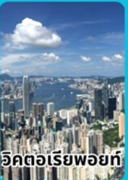
อิคตอเรียพอยท์