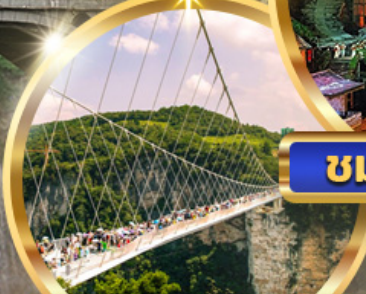
สะพานแก้ว