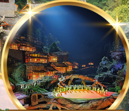
ชมโชว์จิ้งจอกขาว