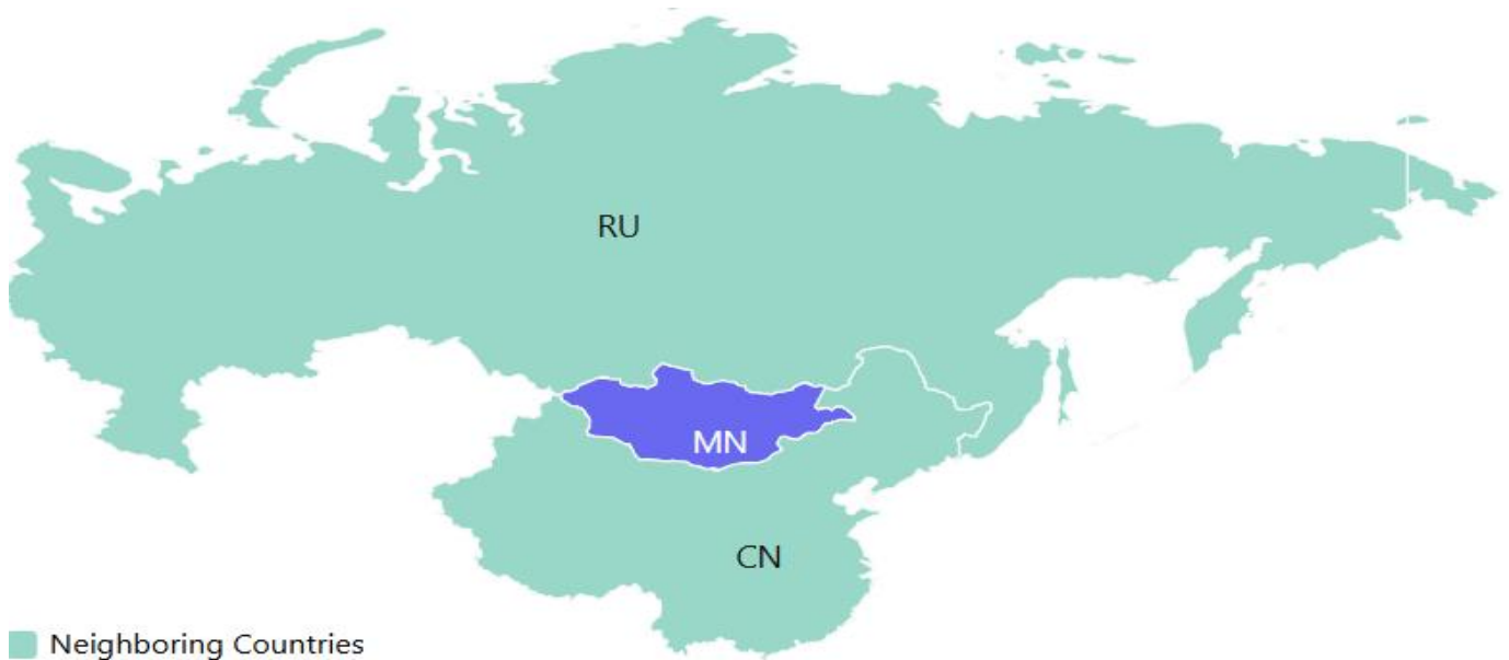
■ Neighboring Countries

มองโกเลีย จะมีสองสถานที่ คือ ประเทศมองโกเลีย (ซึ่งโปรแกรมเราจะเที่ยวที่นี่) และเขตปกครองตนเองมองโกเลียในของสาธารณรัฐประชาชนจีน ซึ่งทั้งสองที่มีความแตกต่างกันทั้งในด้านการปกครองและวัฒนธรรม:-