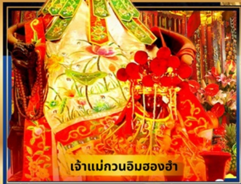
เจ้าแม่กวนอิมสองอ้า