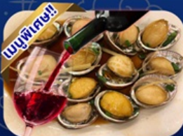
ซีฟู้ด ฟ้าอื้อโฮบิตแดง